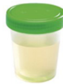
Geel en helder Ziet er zo uit OK, Dit is prima