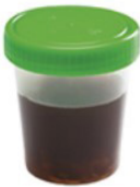
Te donker Te troebel Niet OK

Bij een geslaagde voorbereiding ziet uw ontlasting er het best uit als water of heldere urine .