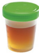
Licht oranje Bijna helder Nog niet OK